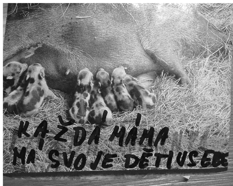
Jeden z obrázků, který matce vytvořily děti v družině

Matka dvou dcer ve věku sedm a devět let o ně vždy vzorně a láskyplně pečovala. Když zjistila, že její manžel, lékař, ji již léta podvádí s kolegyněmi, našla si ve svých 36 letech přítele a odstěhovala se k němu. Děti tak poprvé změnily školu. Po měsíci ale zjistila, že jeho vztah k dětem nebyl takový, jak si přála, a rozešla se s ním. Zpátky k manželovi se však již vrátit nemohla, protože si do bytu nastěhoval jednu ze svých milenek, která s ním krátce nato otěhotněla. Ažyl jí poskytl její bratr, který bydlí ve stejném městě jako otec. Děti se tak po měsíci vrátily do původní školy. U bratra ale nemohla zůstat dlouho. Protože jí manžel odmítl z jejich společného jmění (po dvaceti letech manželství) cokoli vydat, našla si bydlení i zaměstnání (je učitelkou na základní škole) až v jiném, 163 km vzdáleném městě. Otec se změnou školy nesouhlasil. V zoufalství mu tedy nabídla, že mu děti bude vozit na každý víkend a sama si je bude i odvážet. Otec ani s tím nesouhlasil a podal návrh na předběžné opatření, jímž by děti byly svěřeny do střídavé péče rodičů, ovšem s tím, že děti budou chodit stále do původní školy v místě jeho bydliště. Alternativně pak žádal svěřením obou dcer do své výlučné péče.